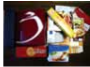
紙箱・お菓子の箱