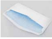
粘着物のついた封筒