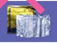
金・銀など金属の箔押し紙