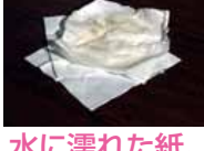
水に濡れた紙、油のついた紙