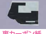
裏カーボン紙、ノーカーボン紙 (宅配便の複写伝票)