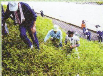
阿南町立阿南第二中学校