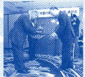
第9回表彰式の模様

※受賞後3年間、受賞活動について「中部の未来創造大賞推進協議会」が後援、他機関が募集する賞や助成活動への推薦を行います。(協議会への申請と確認が必要です。)