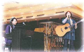
アコースティックライブ by ‘やらフェスバンド’

渚園ならではの「浜名湖の自然環境」についての情報発信をメインに、日常生活に活かせる簡単「3R」知識や簡単「LOHAS」体験を提供します。地元舞阪町の「和太鼓演奏」や地元浜松市の「やらまいか」精神で盛り上がる「やらフェスバンド」による「アコースティックライブ」など企画満載です。今やエコは世界中で最も関心が高いテーマ。「アフリカンダンス「ジャンベ」」も登場し、みんなで踊って“9月20日は、楽しくエコについて考えてみませんか!?”