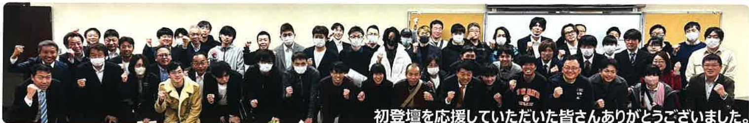
初登壇を応援していただいた皆さんありがとうございました。

バイクメーカー創業地として浜松のブランド価値を活かし、バイクユーザーのニーズにあった道の駅を整備することで、都市の魅力さをさらに広める機会であると捉えている。バイクユーザーの利便性を重視した施設設計を行い地域活性化に貢献することを目指している。