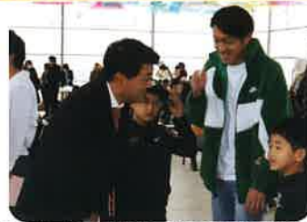
【2月4日】 本田労組 浜松支部 5BLLekでの活動報告