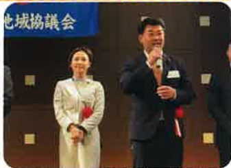
【1月20日】 連合静岡浜松地域協議会 新春賀詞交歓会での挨拶