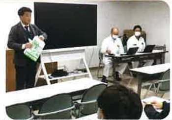
【3月20日】 全本田労連 静岡地協 幹事会での活動報告