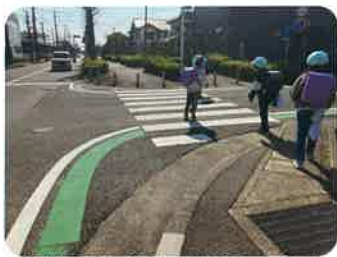
葵が丘小学校付近の交差点 通学路上のグリーンベルト

<内容> (抜粋) 通学路安全対策:児童・生徒の安全な歩行空間確保 (歩道設置、側溝改良など)