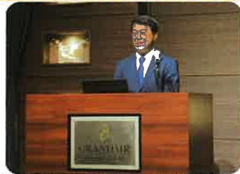
【1月27日】 自動車総連静岡地域協議会 政策コンベンションでの挨拶