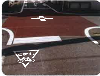
船越小学校付近の交差点 交差点のカラー塗装