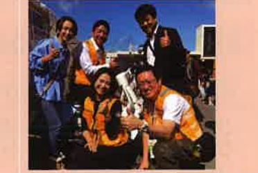
【10月16日】 バイクのふるさと浜松