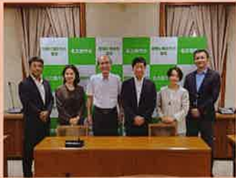
【7月31日】 市民クラブ会派視察 名古屋市議会