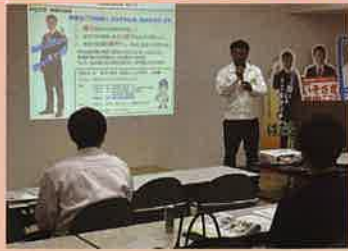
【8月22日】 本田技研労組 浜松支部 新入組合員セミナー