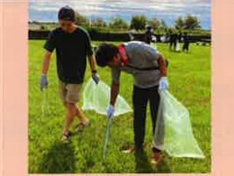
【9月23日】 連合静岡浜松地域協議会 列島クリーンキャンペーン