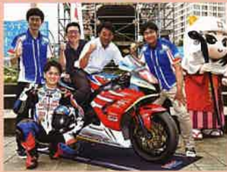
【7月15日】 鈴鹿8時間耐久ロードレース 浜松市チーム壮行会