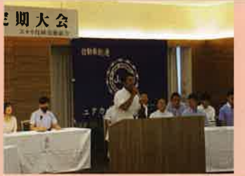
【8月26日】 ユタカ技研労組 第38回定期大会