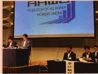
【9月17日】 全国本田労働組合連合会 第56回大会