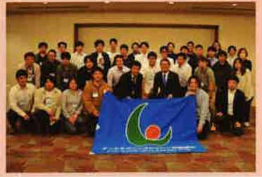
【10月13日】 オートテックジャパン労組西日本支部 拡大執行委員ゼミ