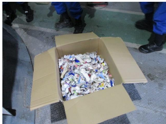
日本製紙(株)関東工場 草加にて試験的実証