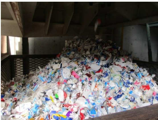
破碎されて出てきた紙容器