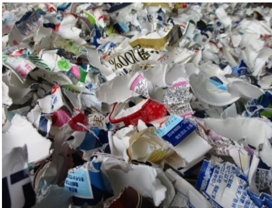
拡大するとこんな感じ