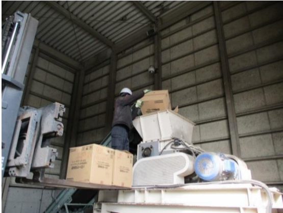
二軸破碎機を使い破碎