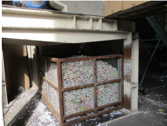
破碎された紙容器