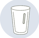
小鉢・マグカップ 酒器・グラス