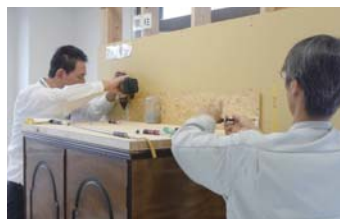
過去の家具固定セミナーの様子（ママゼミではありません）