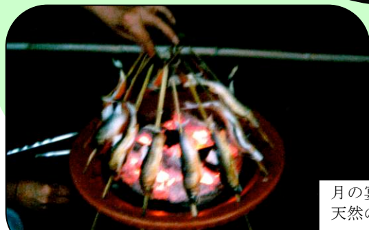
月の宴 天然のアユ！